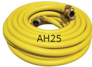
Air Hose 25 m. สายลม 25 ม.