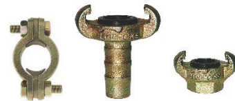
Coupling ข้อต่อสายลม