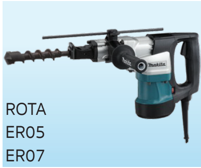
ROTA ER05 ER07