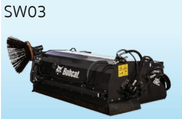
อุปกรณ์ติดตั้งกับรถตักอนุกรมประสมค์ขนาด 0.3 ม 3 (SL03)