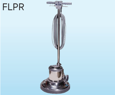
อุปกรณ์เสริม